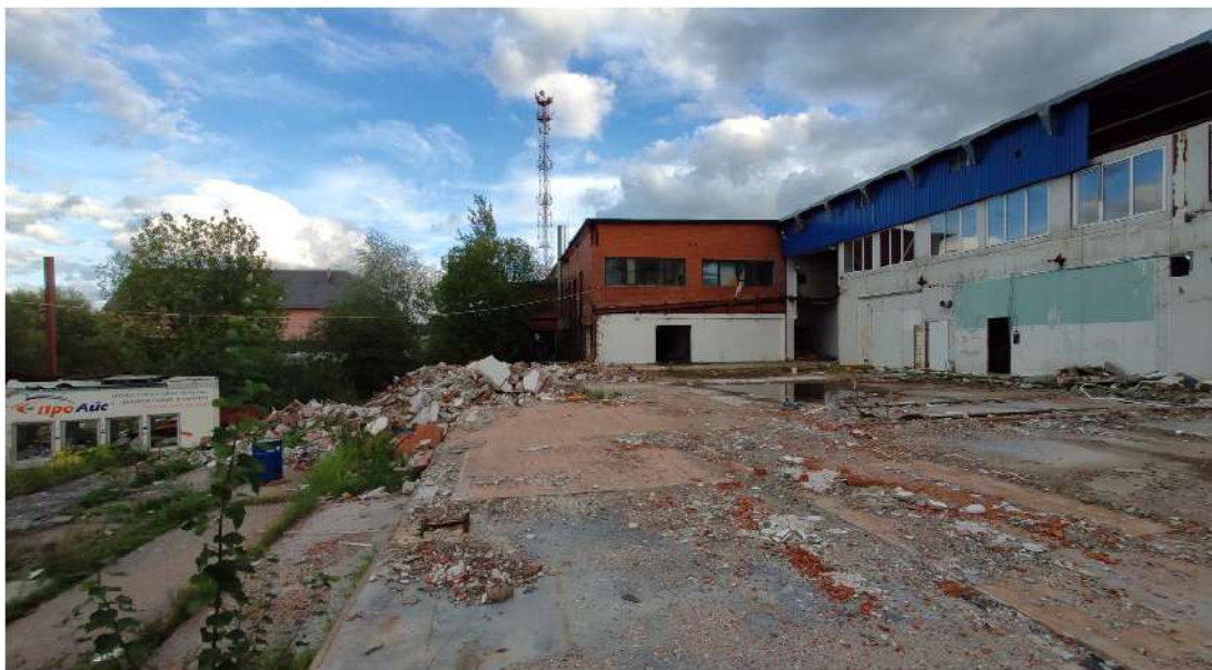
13. производственное здание