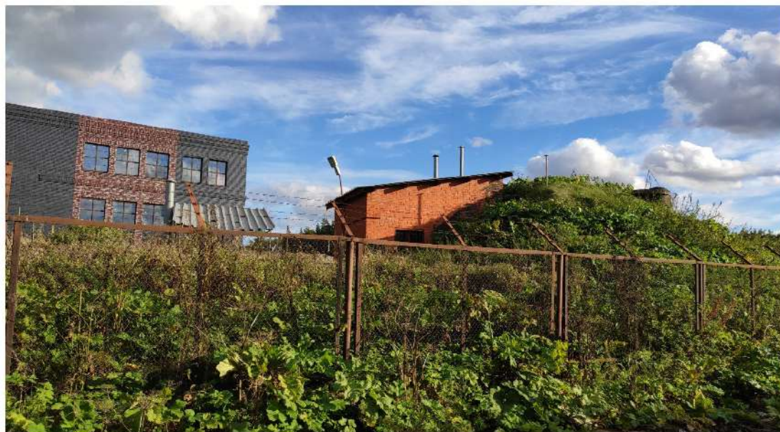
20. скважина, водозаборный узел