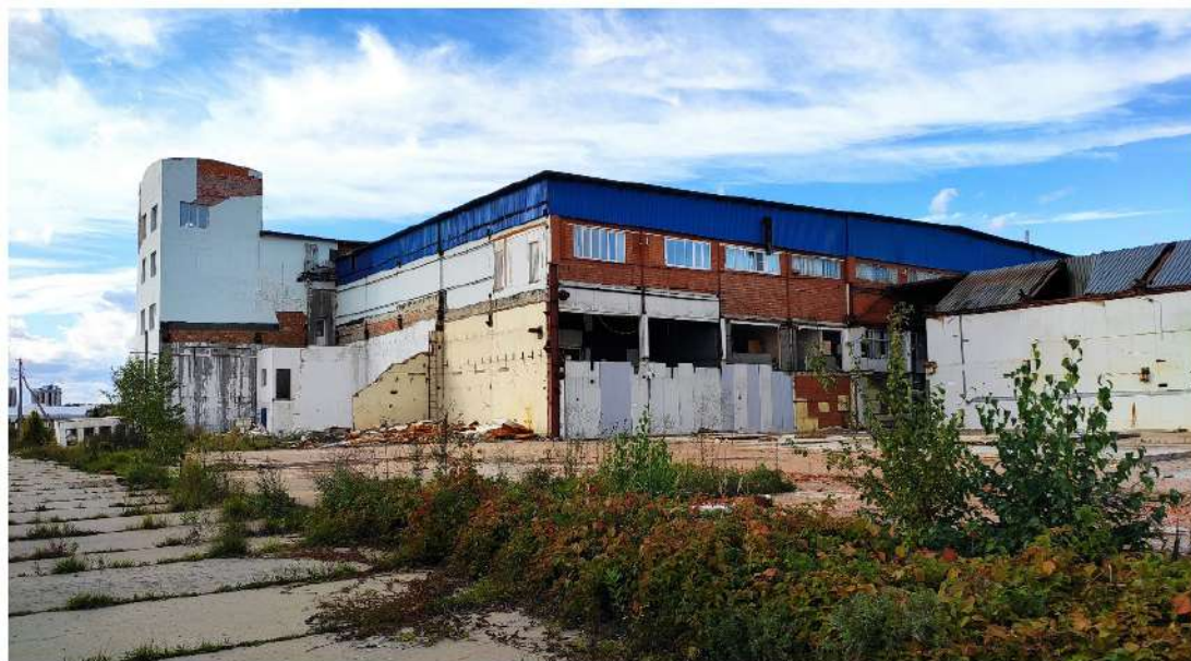
32. производственное здание