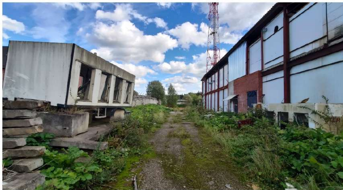
16. дорога, нежилое здание