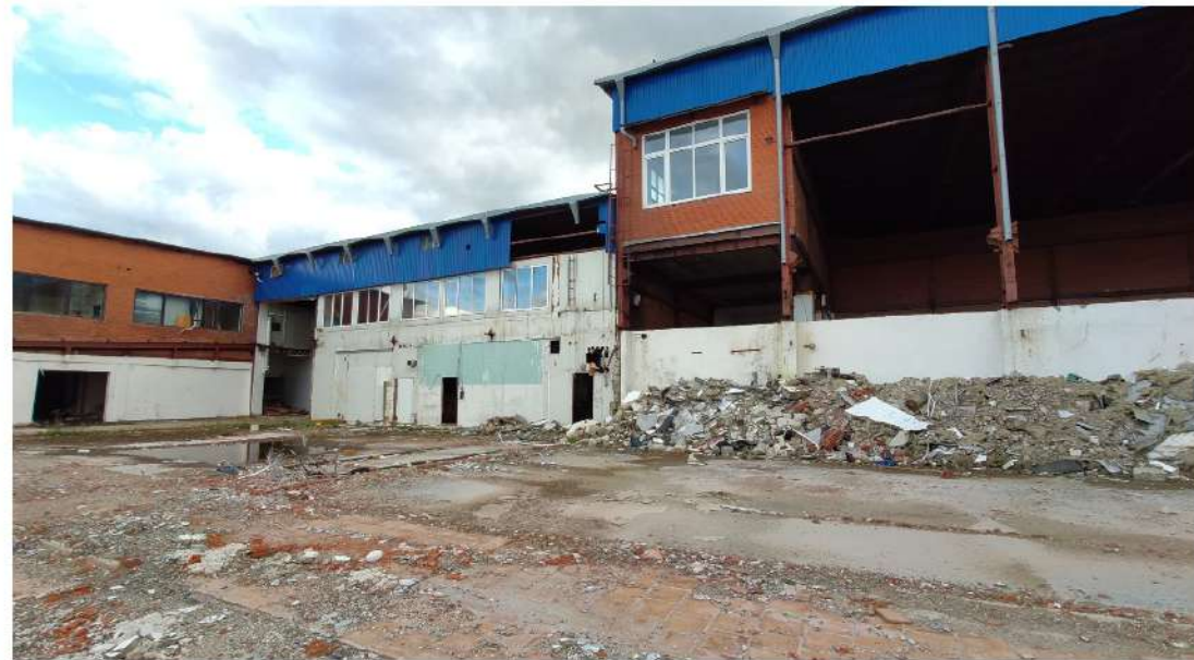
12. производственное здание