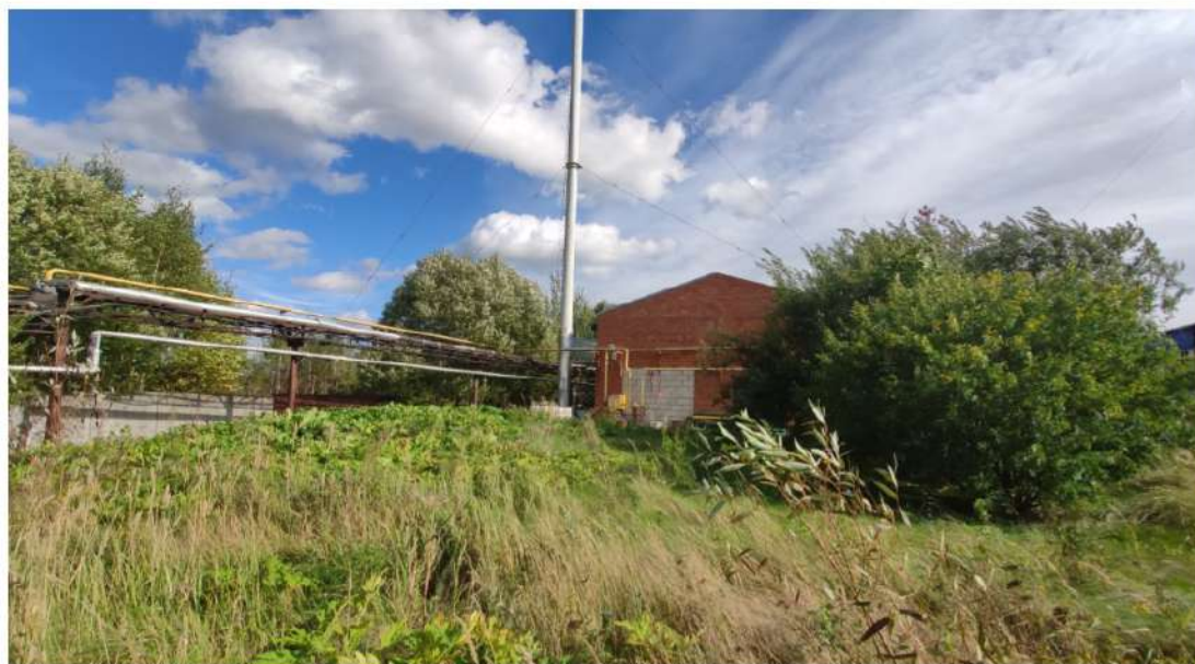
3. производственное здание