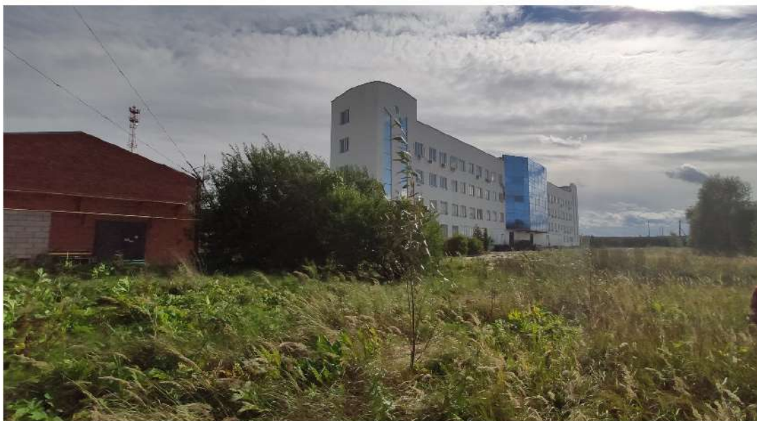
7. котельная, производственное здание