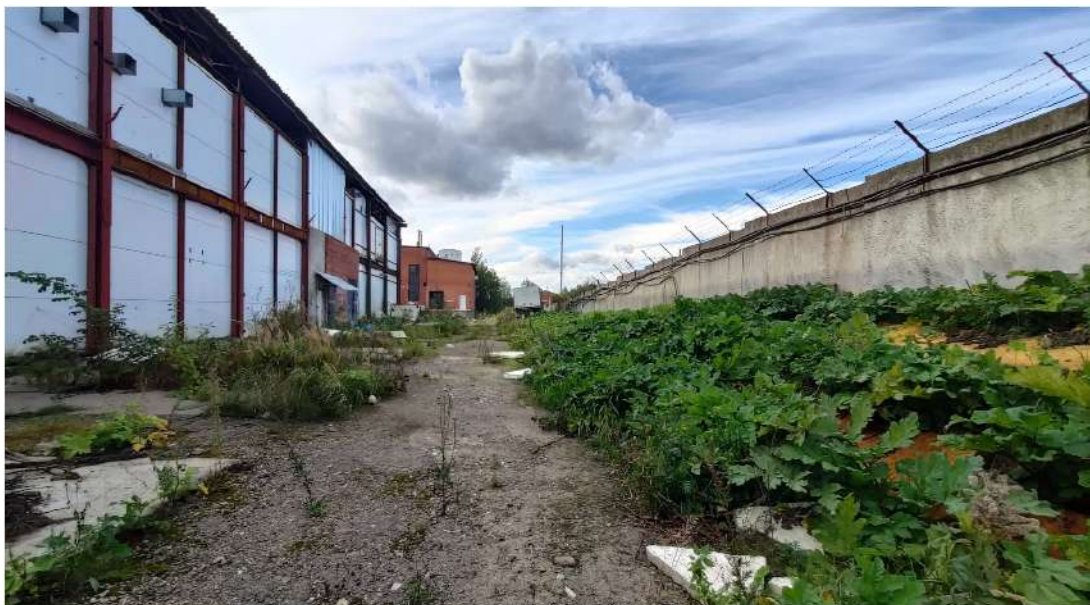
17. дорога, нежилое здание