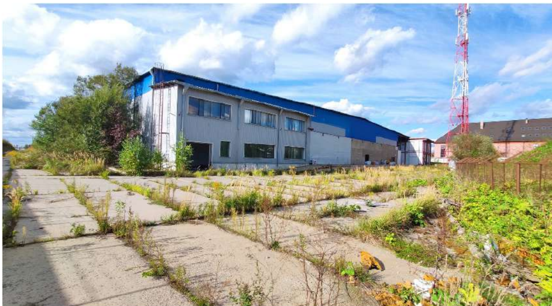
21. нежилое здание