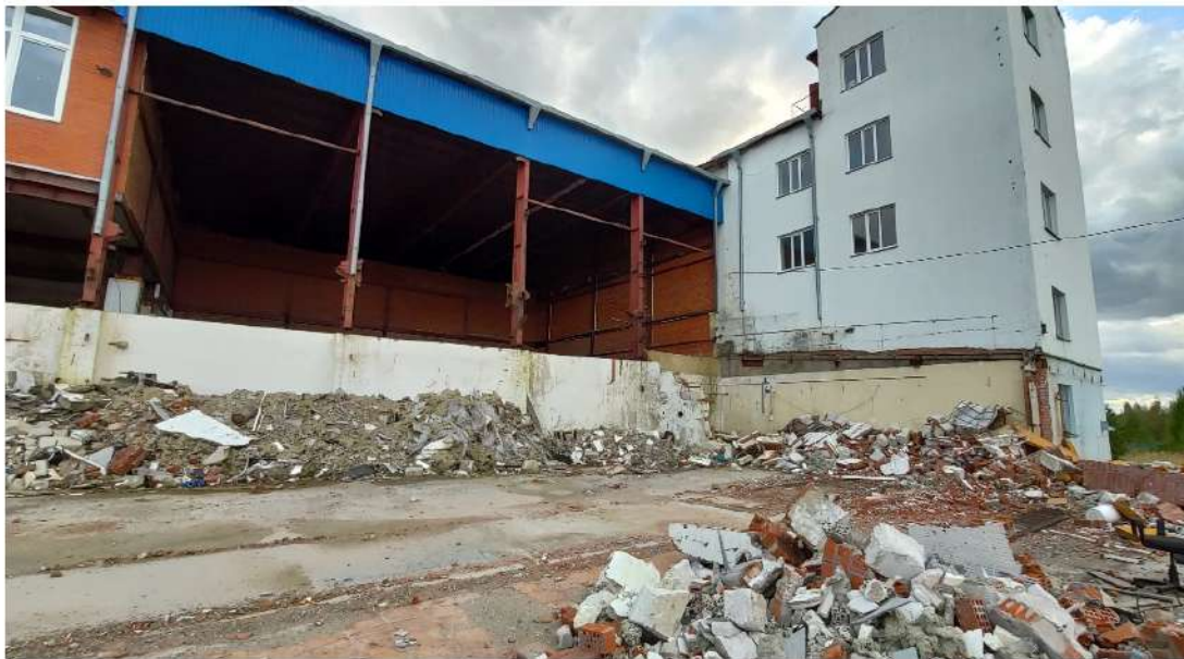
11. производственное здание