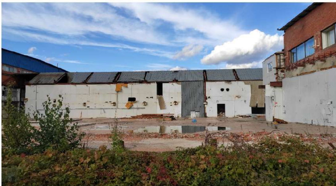
31. производственное здание