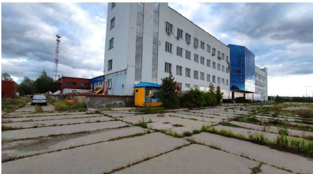
35. площадка, производственное здание