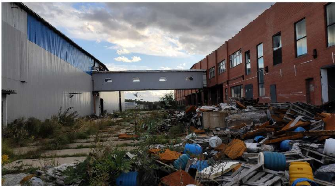
15. производственное здание, площадка