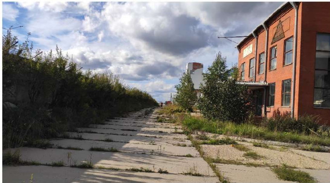
27. производственное здание