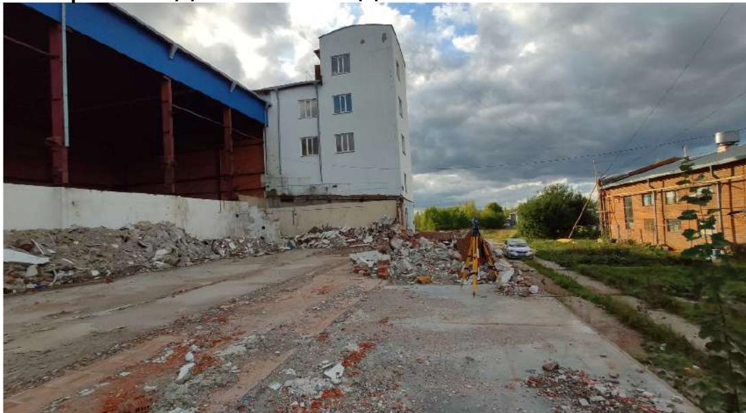
9. производственное здание